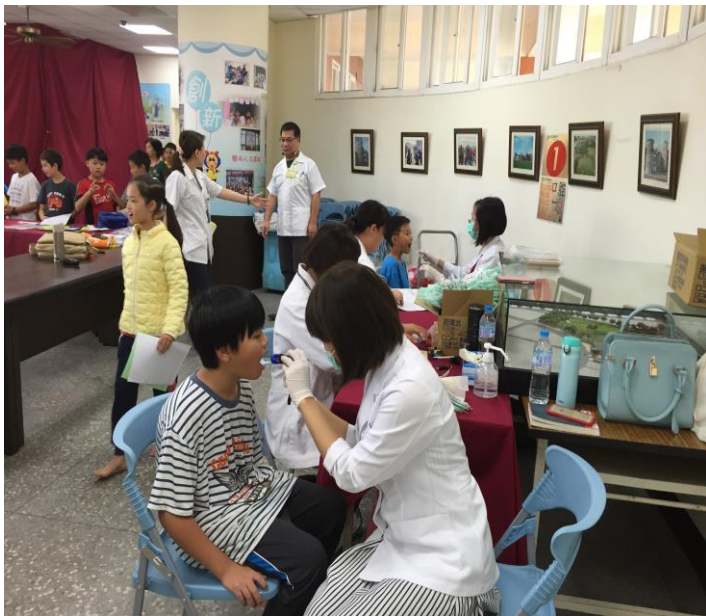
牙醫師檢查牙齒、口腔