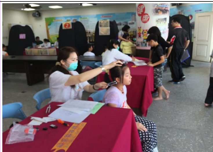
護理師為學童做聽力檢查