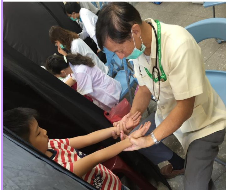
醫師仔細檢查四肢皮膚外觀