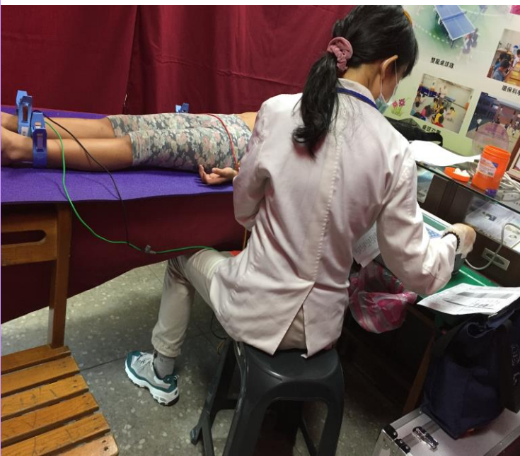
醫檢師為一年級新生全面心電圖檢查