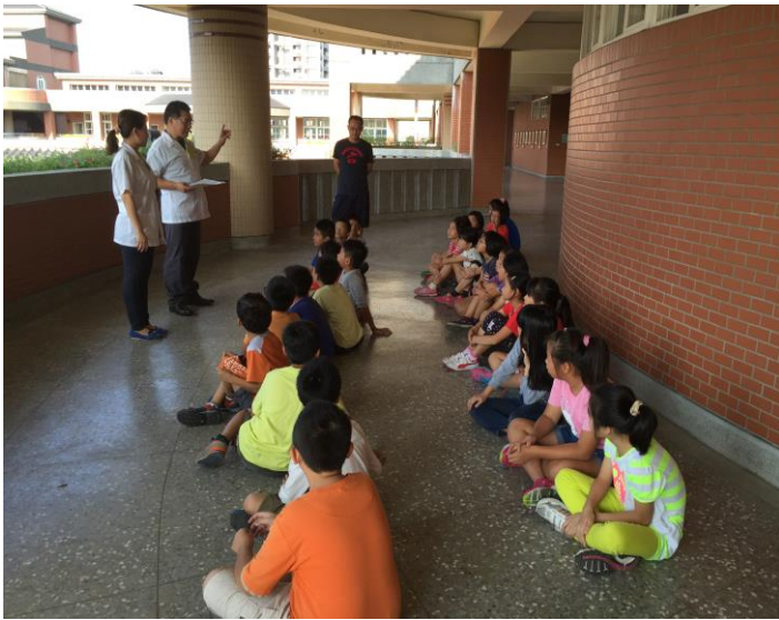
檢查前除觀看 VCD，醫院再次說明流程。