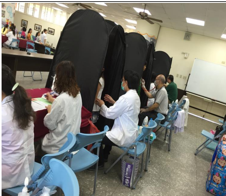
醫師理學檢查，護理師跟診，獨立隱私空間