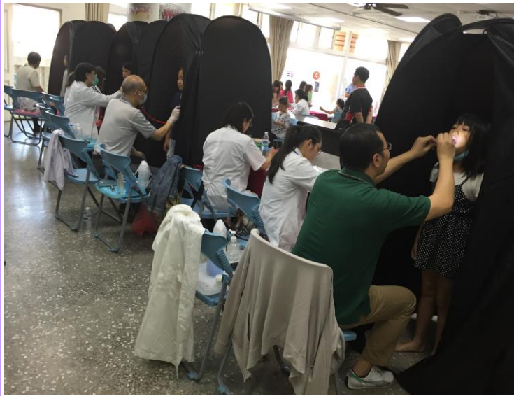
醫師鼻部、扁桃腺、咽峽等檢查