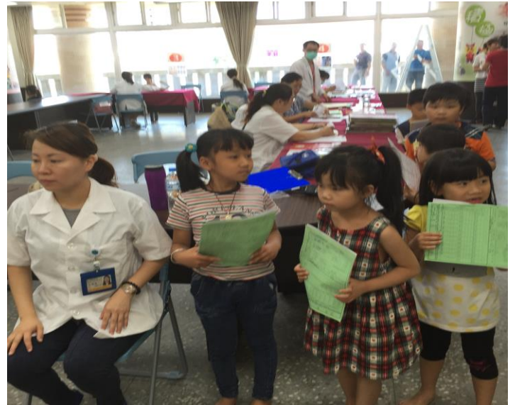
登記資料排隊檢查，醫院細心人員引導