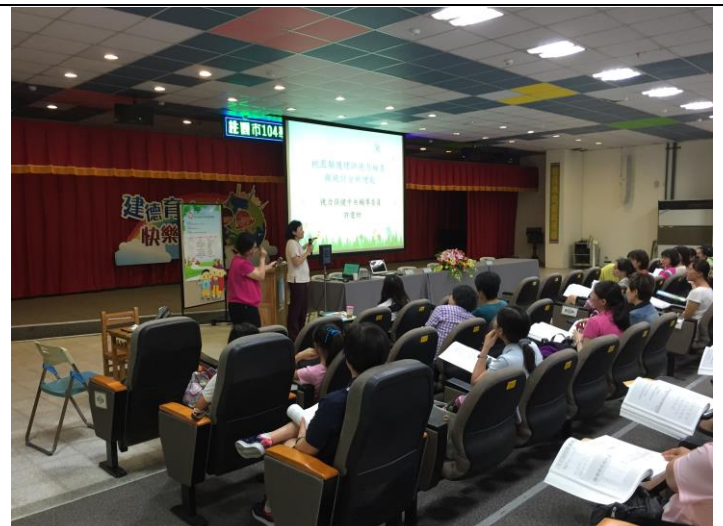
護理師參加檢查前研習討論，確保服務品質